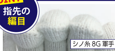
シノ糸 8G 軍手