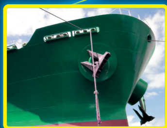
アンカーチェーン