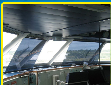
ローラースクリーン