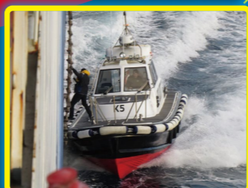
パイロットラダー