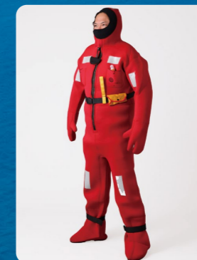
イマーションスーツ